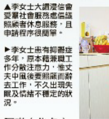
▲李女士大讚浸信會愛羣社會服務處信託照顧者休息服務，且申請程序很簡單。

李女士表示，之前精神十分緊張，得到中心幫助，定期讓她釋放情緒：「不用做每件事都急匆匆，可以放慢步伐，減少心理壓力。」現在她在放假期間，會去做電療按摩，舒緩因照顧而出現的膝痠背痛，也讓自己心靈得到放鬆。身為過來人，李女士明白每周有休息日的重要性：「就像橡筋繃得太緊，也有機會斷的。」